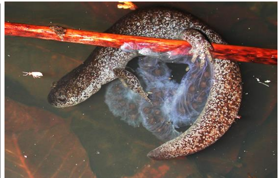
トウキョウサンショウウオの雄と卵のう